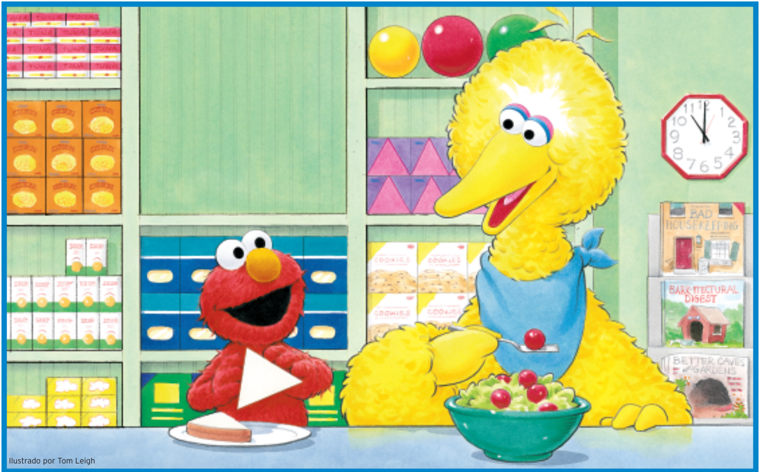
Ilustrado por Tom Leigh

¡Hay muchas formas en la Tienda de Hooper! ¿Cuál es la forma del almuerzo de Elmo? Circula las formas que encuentres en el dibujo. Di sus nombres en voz alta.